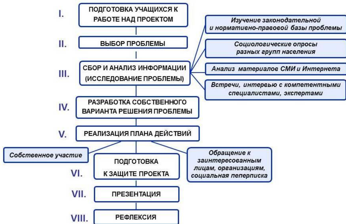
Схема работы над проектом:

Папка документов представляется в электронном варианте для анализа логики работы команды по разработке и реализации проекта: